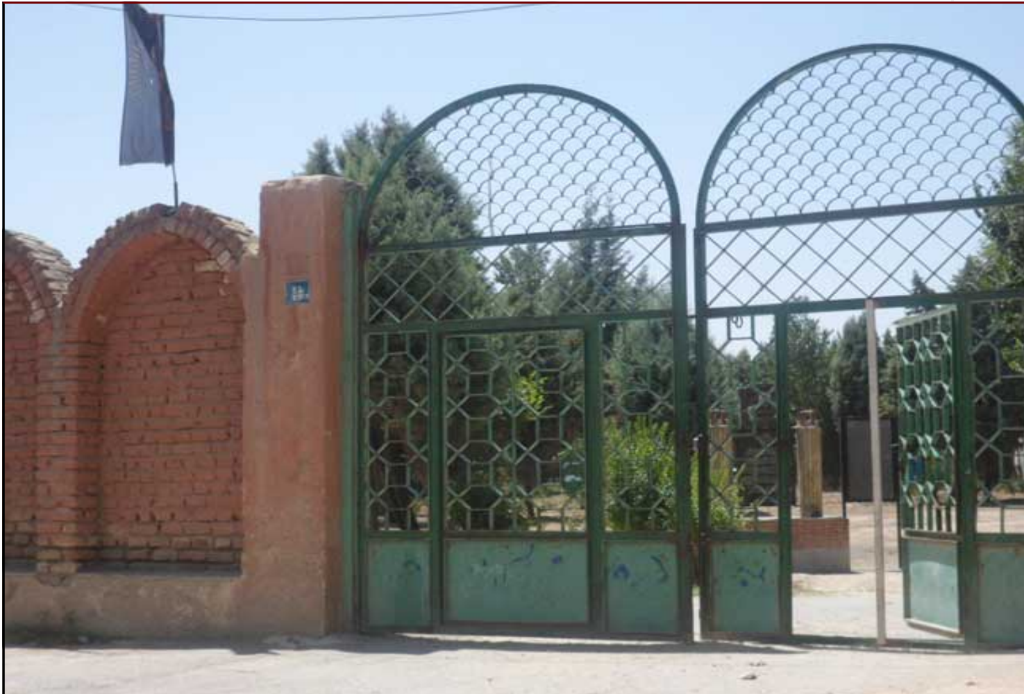
ده شاه ابوطالب (ع) واقع در شهرستان اسلامشهر - بخش مرکزی - دهستان احمدآباد مستوفی روستای فیروز بهرام مساحت عرصه: ۲۱۵۳۸ متر مساحت اعیان: *

وجود امامزاده ای به نام جعفر ابوطالب مورد تأیید علمای انساب می باشد، و شجره ی حضرت در کتاب «الفخری فی انساب الطالبیین» (ص 27) به امام جعفر صادق می رسد. آستان امامزاده ابوطالب (علیه السلام) در شمال اسلامشهر و شمال به بزرگراه تهران - ساوه، و از شرق به روستای شمس آباد، از غرب به روستاهای حسن آباد و رضی آباد و یوسف آباد، و از جنوب به روستای گلدسته محدود می شود. مزار امامزاده در میان بوستانی مصفا با درختانی تنومند و قدیمی، و در قبرستانی یک هکتاری واقع شده است که در حال حاضر فاقد بنا می باشد، و سابقه ی قبرهای آن گورستان به بیش از صد سال پیش می رسد، و در آن میان مزار پنج شهید به معنویت گورستان افزوده استف پنج شهید دفاع مقدس در سال های 61 و 62 و 65، 1366 می باشند. سنگ قبری سیمنی در ابعاد 163&times;26&times;113 سانتی متر (بدون گنبد و ضریح و صندوق و فاقد چاردیواری و سقف) در میان قبرستان روستا به چشم می خورد که به امامزاده جعفر ابوطالب مسمای می باشد. مساحت اعیان آن 21539 متر مربع می باشد. آدرس: استان تهران - شهرستان اسلام شهر - بخش چهاردانگه - شهر - دهستان فیروزبهرام - روستای فیروزبهرام، خیابان میرزااقوام، کوچه ی بوستان شهدا