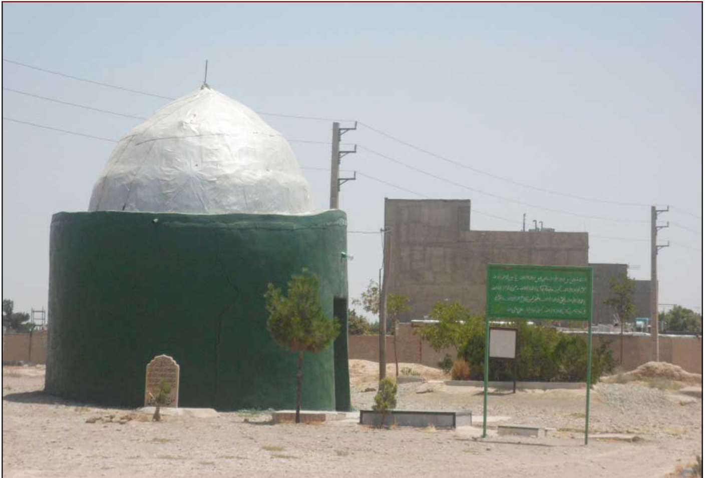
امامزاده محمد (ع) واقع در شهرستان اسلامشهر - بخش مرکزی - روستای ایرین مساحت عرصه: ۲۸۶۸ متر مساحت اعیان: حدود ۱۷ متر

صاحب کتاب «اختران فروزان ری و طهران» (473) در خصوص تاریخچه و شجره ی امامزاده این بزرگوار تا امام حسن مجتبی (علیه السلام) هفت پدر فاصله است، و قبر این بزرگوار و برادرش ابوالحسن علی الاصر در روستای ششکلو مزار معتبريست؛ و گمان نگارنده این است که اصل آن لقب «ششدیو» پدر این دو بزرگوار است که در کنار یکدیگر واقع شده اند. امامزاده محمد ششدیو اولین امامزاده ای است که به این قریه نازل شده است و سکونت نموده، و ممکن است بانی تأسیس آن قریه خود آن جناب بوده باشند، و بدین سبب روستا نام خود را از ایشان اخذ کرده است. مؤلف در ادامه آورده است که سید محمد ششدیو دارای هفت پسر بوده اند: 1) ابوهاشم حسین؛ 2) ابوطالب محمد؛ 3) ابوالعباس احمد (مانکدی)؛ 4) حمزه (که اولادی نداشته)؛ 5) الناصر عیسی؛ 6) ابوطالب حسین؛ 7) ابوزید حسن القاری (شهید در خراسان). قدمت: دوره قاجاریه - پلان:مدور و پوشش گنبد پله ای - مصالح: خشت و آندود کاهگل