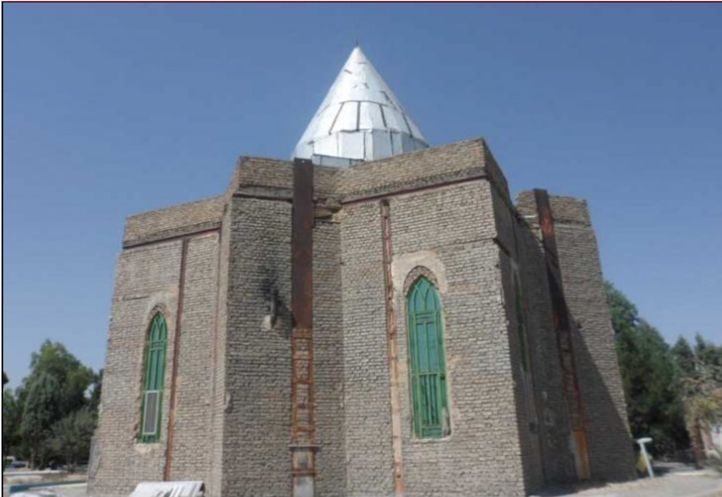
آباده سید رضا (ع) واقع در شهرستان اسلامشهر - بخش چهاردانگه - روستای علی آباد قاجار حاجت عرصه: ۱۵۵۷۷ متر مساحت اعیان: حدود ۵۰۰ متر

واقع در نزدیکی روستای حسین آباد مفره در قسمت شرقی اسلامشهر منسوب به امام موسی کاظم (ع):