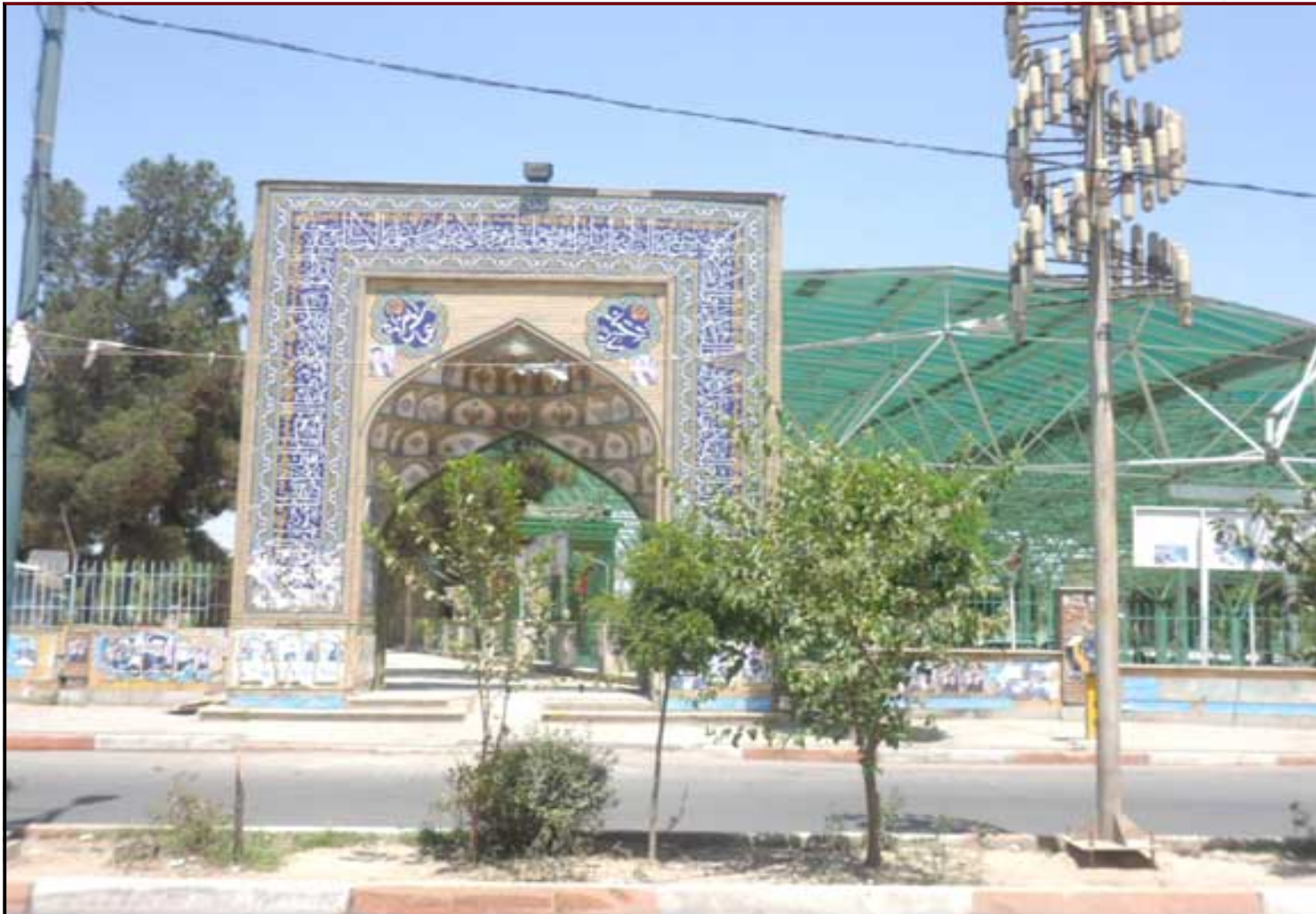
آباده عباس (ع) واقع در شهرستان اسلامشهر - بخش چهاردانگه - شهر چهاردانگه حت عرصه: ۹۷۷۱ متر مساحت اعیان: حدود ۱۵۰ متر

امامزاده عباس (عليه السلام) از نوادگان امام زین العابدین (عليه السلام) است و به ۱۰ فاصله به وی می رسد. در کتاب الفخری فی انساب الطالبیین، ص ۷۵ نسب امامزاده مشخص شده است.