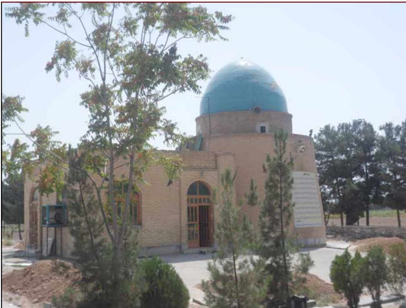
امامزاده ابراهیم (ع) واقع در شهرستان اسلامشهر - بخش مرکزی - دهستان ده عباس - روستای نظام آباد مساحت عرصه: ۲۹۰۷۲۶ متر مساحت اعیان: حدود ۴۰۰ متر

آستان امامزاده ابراهیم (علیه السلام) در جنوب شهرستان اسلامشهر واقع، و از شمال به روستای ده عباس و کمر بندی الغدیر اسلامشهر، و از شرق به روستای کاشانک، و از غرب به روستان میان آباد، و از جنوب به بزرگراه تهران - قم و روستای طوقوزآباد محدود می شود. این بقعه در کنار رودخانه ی کن (کانال شهید نواب صفوی) واقع شده است، و اطراف آن گورستان محلی و بوستان شهداست، و قدیمی ترین سنگ قبر آن تاریخ 1230 ق را داراست. بنا به نوشته روی سنگ قبر مرمین: «ابراهیم بن ابی عبدالله بن محمد بن عبدالله بن عبدالله الحسن ابن جعفر بن حسن مثنی بن امام حسن مجتبی (علیه السلام) می باشد. وجه تسمیه روستا به آبادگر آن بر می گردد: نظام. تا چهل سال پیش، اطراف روستا حصاری بوده است با دیواری کاهگلی و کنگره ای؛ و در چهار جهت این حصار، چهار دروازه قرار داشته و در فاصله 4 کیلومتری شمال بقعه، امامزاده عقیل واقع شده اند. و از 2 کیلومتری بقعه، گنبد فیروزه ای آن در میان درختان سرسبز چون نگیب درخشیدن دارد که توجه هر بینایی را به خود جلب می سازد. قدمت اولیه آن به دوره صفویه باز می گردد و در دوره های جدید تر برخی قسمتها به آن اضافه شده است. بنای مزبور در مساحتی حدود ۲۰۰۰۰ متر مربع قرار دارد.